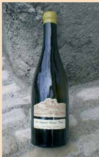
PRÉAMBULÉS 2007 VIN MOUSSEUX BRUT PATRICE LESCARRET - DOMAINE DE CAUSSE MARINES - VIEUX

Une fermentation en bouteille selon la méthode ancestrale à Gaillac pour ce mousseux de mauzac. Ce cépage s'adapte bien à ce style de vin avec d'agréables arômes au nez de pomme et de poire, de rhubarbe et de biscuit à la cannelle. On ne s'arrêtera pas à la robe assez trouble pour profiter sans retenue d'une bouche au joyeux pétilllement, d'une élégante légèreté. (Pas de sulfitage)